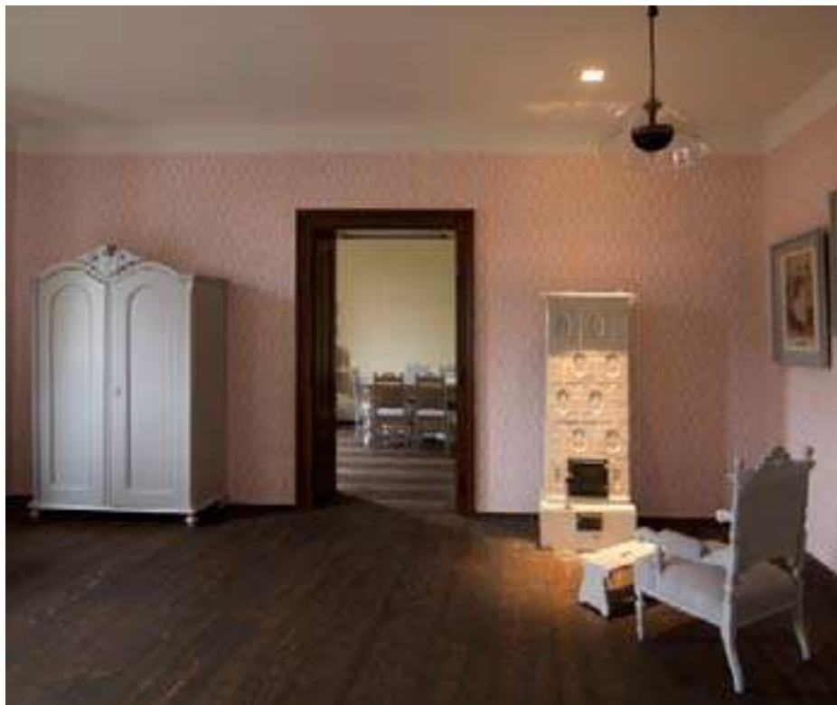
Geburtshaus Egon Schiele, Tulln © Hans Eder