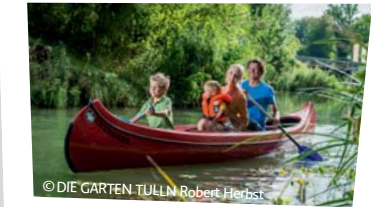
Ab in die Boote