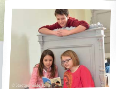
Den jungen Schiele entdecken