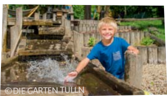
Abenteuer im Garten