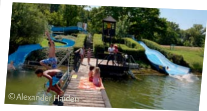
Freizeitspaß im Aubad